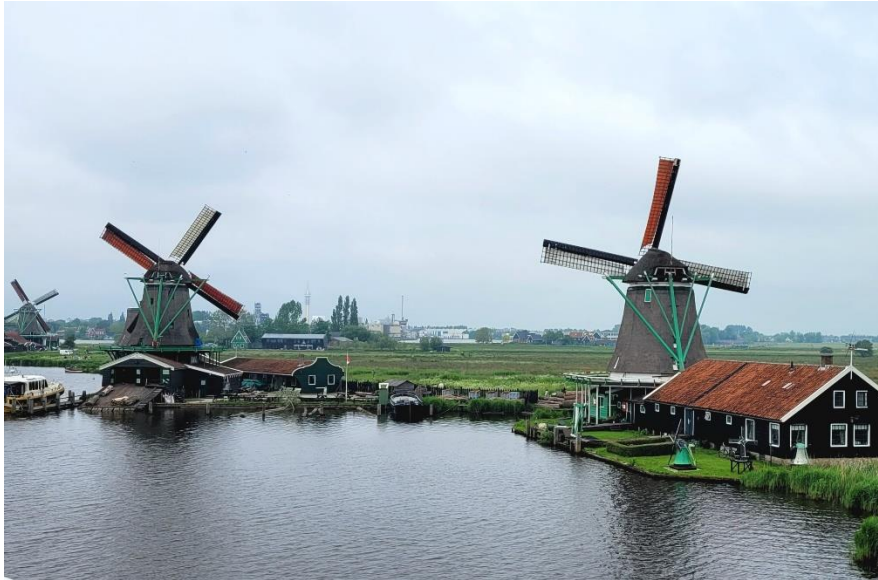
Tuulimyllyjä Zaanse Schansin ulkoilmamuseossa

Vietin viikon opiskellen syvädemokratian saloja Amsterdamissa, Molinos De Viento -nimisen Europass Academy -kouluttajan järjestämällä kurssilla.