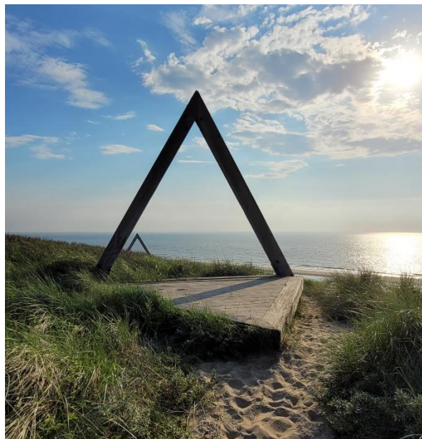
Kuva pyörälänkin varrelta Zanvoortista

Kertasimme Maslowin tarvehierarkian ja Bloomin taksonomian ja pohdimme käytännön luokahuonetilanteita mallintavissa tilanteissa, milloin oppilaan haasteet johtuvat tyydyttymättömistä perustarpeista ja milloin haasteista oppimisessa. Keskustelimme Bloomin taksonomian tasoista ja oppilaan tason tunnistamisesta. Milloin voidaan sanoa, että oppilas muistaa opitun asian ulkoa, mutta ei vielä ymmärrä sitä syvällisemmin, milloin syntyy ymmärrys ja milloin opittua asiaa osataan soveltaa itsenäisesti? Missä vaiheessa opittua osataan yhdistää aikaisempi hankittuun tietoon? Harjoitusten tarkoitus oli oppia tunnistamaan oppilaiden turhautumista ja oppimisen haasteita aiheuttavia taustatekijöitä ja pyrkiä tällä tavoin puutumaan ongelmien juurisyihin.