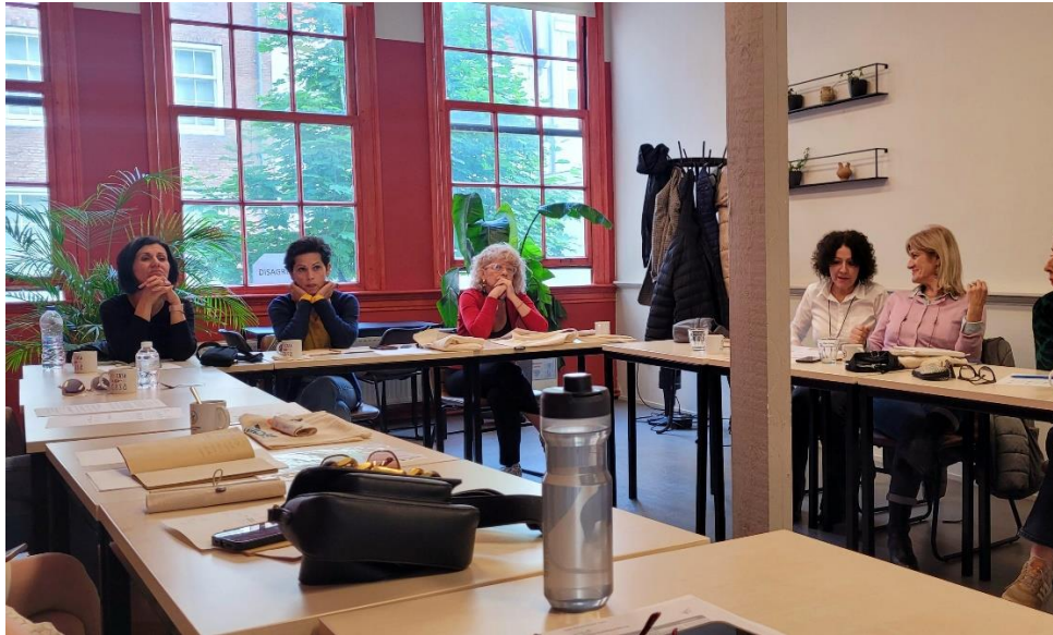
Kurssikavereita Molinos de vionon viihtyisässä koulutustilassa

Kurssin muut opiskelijat olivat Italiasta, Ranskasta, Bulgariasta, Keikasta ja Kyprokselta. Kahta varhaiskasvatuksen opettajaa lukuun ottamatta kaikki olivat peruskoulun aineenopettajia. Kurssilaiset jakoivat huolen lasten ja nuorten heikentyneistä oppimistuloksista ja levottomuudesta luokkahuoneessa. Levottomuuden koettiin johtuvan pitkälti mobiililaitteiden ja sosiaalisen median käytöstä ja siitä seuraavasta keskittymiskyvyn heikkenemisestä. Myös koronanaikaisen eristyksen vaikutukset nuorten sosiaalisiin taitoihin koettiin yhteisenä huolenaiheena. Europass Academyn kurssi olikin syntynyt tarpeesta kouluttaa opettajia rakentamaan keskustelevaa ja kunnioittavaa ilmapiiriä koululuokassa ja yhteydenpidossa vanhempien kanssa. Yhteiskunnan polarisaation ja erityisesti verkkoalustoilla näkyvän keskustelukulttuurin kärjistymisen tiedetään aiheuttavan konfliktiherkkyttä myös kouluissa. Kurssikaverit kertoivatkin kurssin ja riitojen selvittelyn vievän yhä enemmän aikaa opetuksesta ja he toivoivat saavansa kurssilta konkreettisia työkaluja konfliktinratkaisuun.